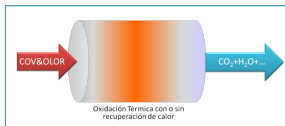
Figura 1. Principio funcionamiento oxidación térmica

En los casos en que los gases a tratar contengan compuestos orgánicos volátiles halogenados es necesario un post-tratamiento de las emisiones con una torre de lavado ácido.