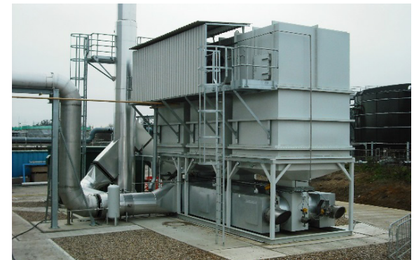
Figura 5. RTO de 3 lechos para 26.000m 3 /h