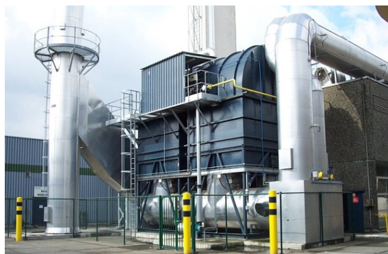
Figura 3. RTOP de 2 lechos para 80.000m 3 /h